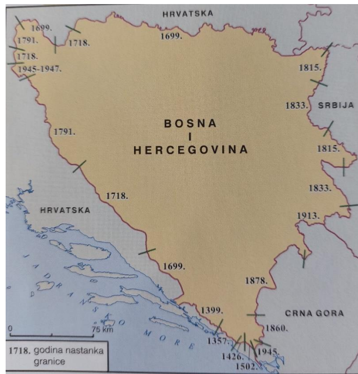
Slika 2. Godine nastanka granica Bosne i Hercegovine s naglaskom na 1718. godinu.

Pa, što će tu granica? – opet Ivan o granici. Čini mi se kako pomišlja da branim granicu, a ja mu samo objašnjavam ono što znam o tome. Ivanu je granica tek sad zasmetala, a meni smeta odavno. (Ivan Ićan Ramljak, Prijelaz granice , 1999)